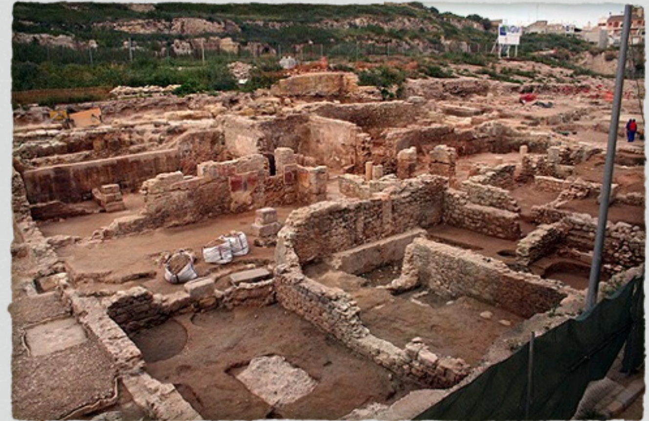
Ayuntamiento de Cartagena

La alcaldesa ha invitado a todos los cartageneros a acudir al Molinete cuando las obras terminen para contemplar unas vistas únicas desde esta zona de la ciudad y disfrutar, además, de la zona arqueológica, de un área de paseo ajardinada.