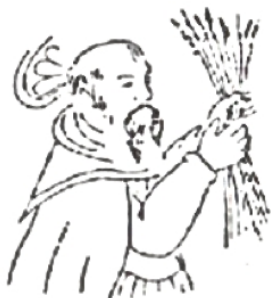
Retrato de San Ginés pintado en uno de los muros de la ermita de Nuestra Señora de los Ángeles.